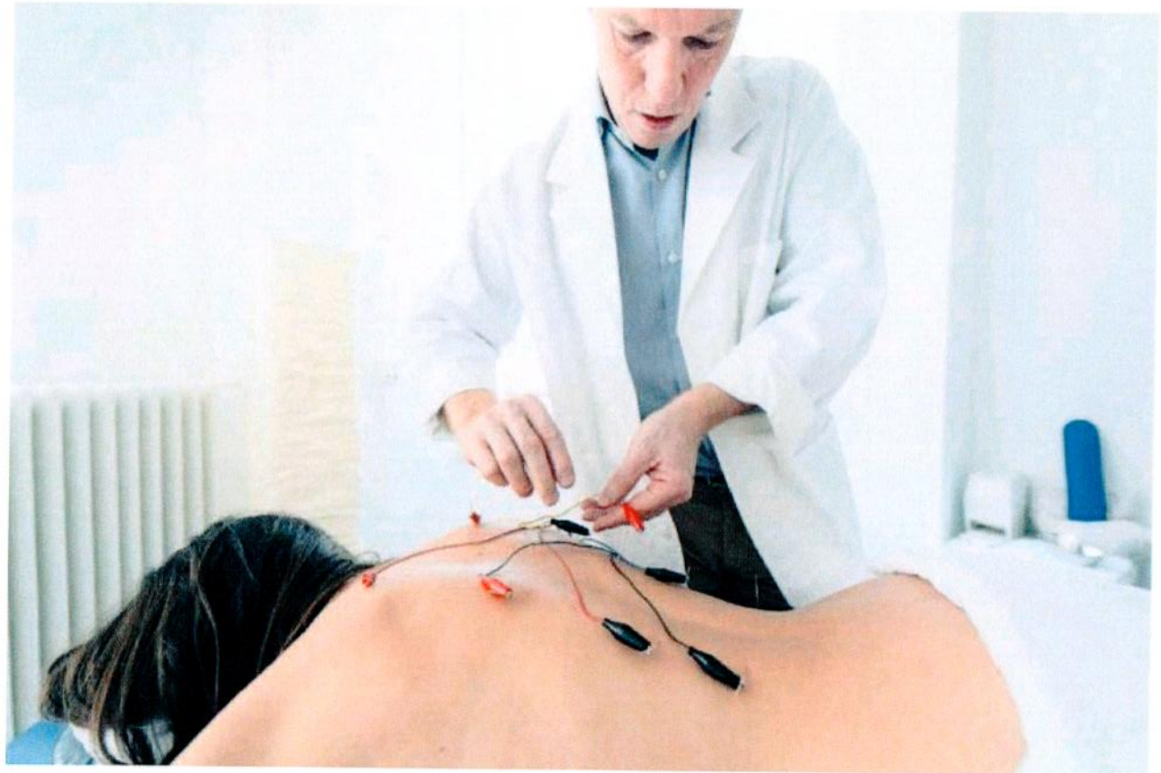
Gehört zu einer schwindenden Minderheit: Arzt, der mit Akupunktur behandelt. (Lausanne, 23. 5. 2013)

Verfassungsartikels zur Komplementärmedizin, für den sich die Schweizer Stimmberechtigten 2009 ausgesprochen